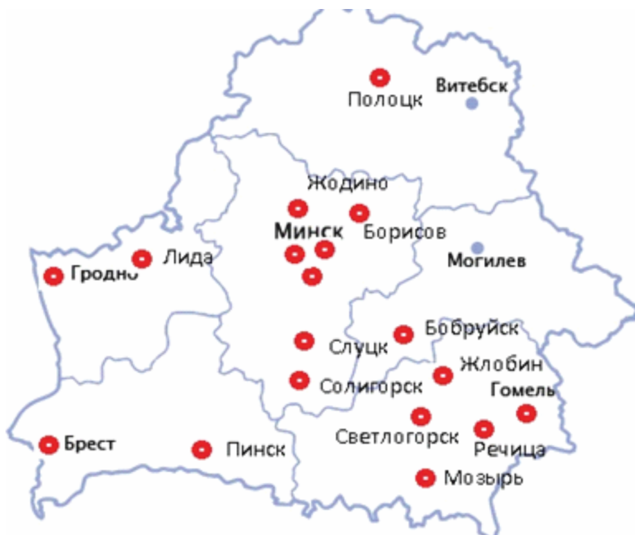
Рисунок 4. Географическая карта пунктов предоставления услуг ПТАО в Республике Беларусь