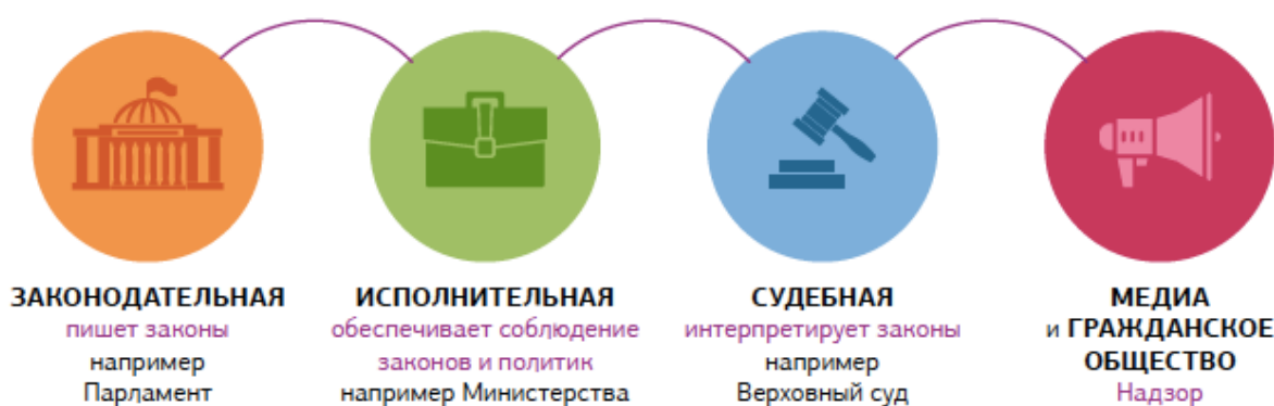
Рисунок 3. Ветви государственной власти 3+1

В современных демократических обществах важную роль играют социальные группы, которые могут оказывать воздействие на все три ветви. Их часто определяют как четвертую ветвь власти. К таким группам относятся средства массовой информации, сообщество журналистов, субъекты гражданского общества, гражданские активисты и, в целом, группы, занимающиеся адвокацией и наблюдательной деятельностью (общественным контролем).