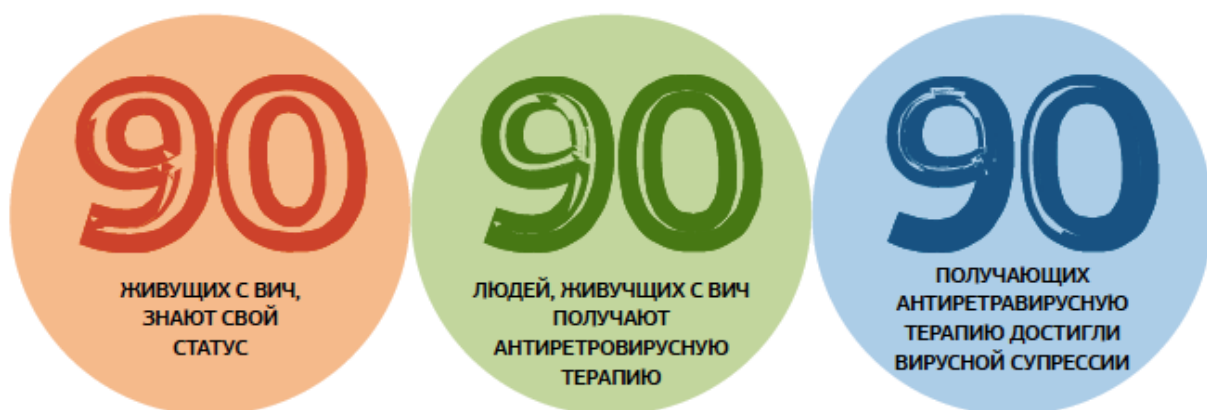
Рисунок 2. Цели 90–90–90

Международные цели, связанные с ВИЧ-инфекцией, были определены и установлены на самом высоком уровне. Согласно «Целям в области устойчивого развития» (SDGs), борьба с эпидемией ВИЧ-инфекции должна быть завершена к 2030 году, в то время как ЮНЭЙДС призвала к достижению целей «90–90–90» к 2020 году. Программы снижения вреда играют важную роль в достижении целей «90–90–90» среди людей, употребляющих наркотики.