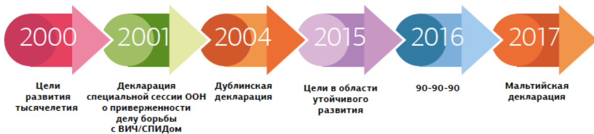
Рисунок 1. Хронологическая последовательность ключевых политических решений, касающихся услуг по ВИЧ для ключевых уязвимых групп

Международные цели, связанные с ВИЧ-инфекцией, были определены и установлены на самом высоком уровне. Согласно «Целям в области устойчивого развития» (SDGs), борьба с эпидемией ВИЧ-инфекции должна быть завершена к 2030 году, в то время как ЮНЭЙДС призвала к достижению целей «90–90–90» к 2020 году. Программы снижения вреда играют важную роль в достижении целей «90–90–90» среди людей, употребляющих наркотики.