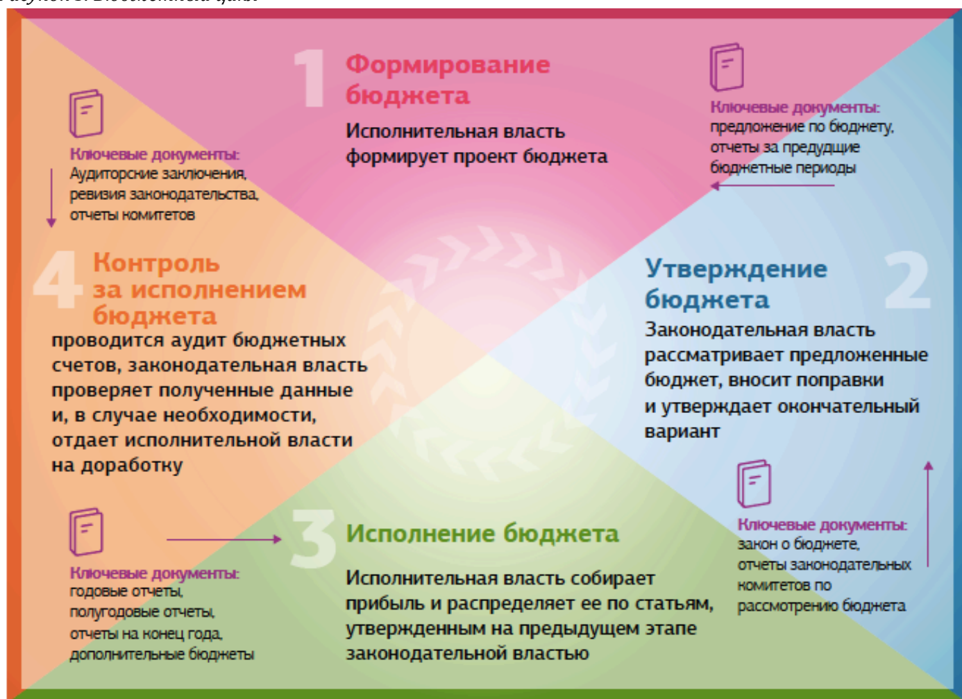
Рисунок 5. Бюджетный цикл

Бюджетный цикл обычно рассматривается в виде четырехступенчатого процесса: